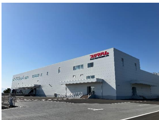
鹿児島県いちき串木野市西薩町 17 番地 43

いちき串木野電力（PPA 事業者）がプリマハムの新設工場に太陽光発電設備を設置し、同施設に対して電力を供給。これにより、電気コストの削減に加えて年間約 228 トンの CO 2 削減効果が見込まれます。